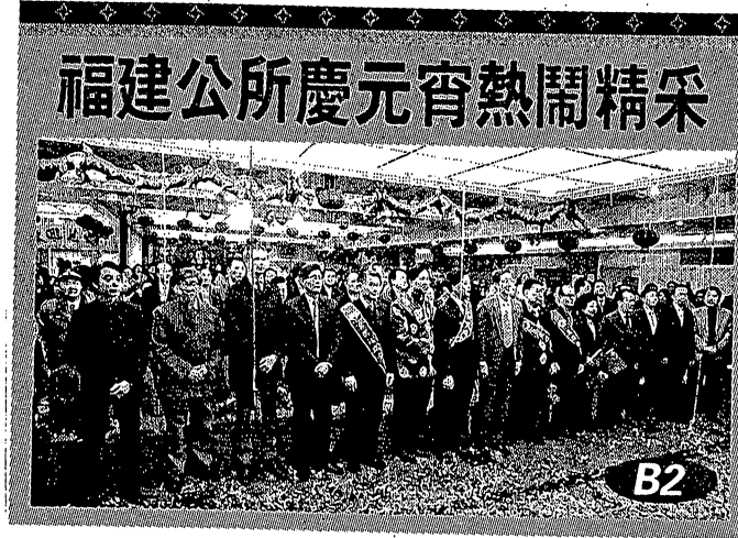
福建公所慶元宵熱鬧精采